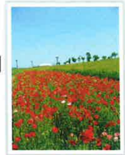
小貝川フラワーカナル